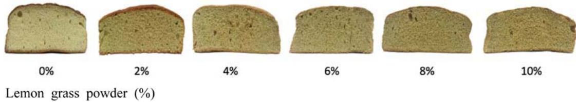
Fig. 1. Visual comparison of sponge cakes incorporated with different levels of lemon grass powder.

2) Means with different letters within a row are significantly different from each other at p < 0.05 as determined by Duncan's multiple range test.